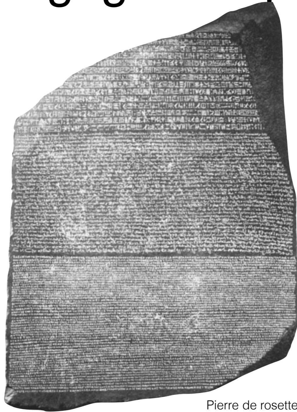
Pierre de rosette